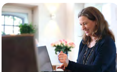
Online-Ausbildung plus 5-Tage-Live

Nur zwei Mal pro Jahr und in kleinen exklusiven Gruppen, findet die intensive, zehntägige (2x5 Tage) Kompaktausbildung auf der Engelsfarm statt. Diese Ausbildungsplätze sind sehr begehrt und meist mit langem Vorlauf ausgebucht. Buche darum gleich heute Dein Klarheitsgespräch, um Dir Deinen Platz zu sichern.